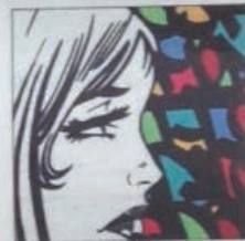
FENX (né en 1974) : Not an easy job, 2014. Bombe aérosol, acrylique et encre sur toile signée, datée et titrée au dos (120 x 120 cm).

de son inauguration en début d'été. Sur les murs de sa galerie : seize signatures, trois générations d'artistes, des techniques variées (pochoirs, bombes, stickers, plinceau...), des supports plus ou moins classiques (toile, papier, métal, bois...) et des influences tout aussi variées. De C215 à Gilbert, de Monkey Bird à Jef Aerosol, en passant par la faune et la flore de Mosko ou l'univers du manga... il y en a pour tous les goûts. « Le street art est le seul mouvement qui soit entièrement et instantanément international », rappelle d'ailleurs le galeriste. Un mouvement à la mode et dé-