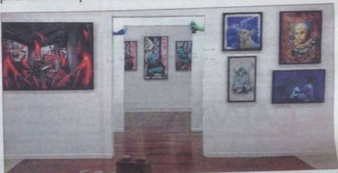
Sur les murs de GCA Gallery : seize signatures, trois générations d'artistes, et des techniques et influences très variées.