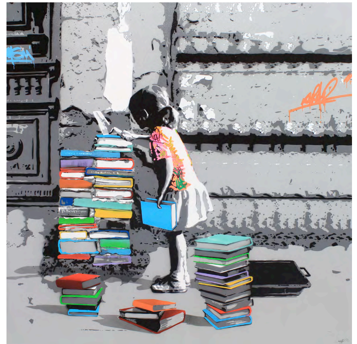
KURAR (né en 1983) Knowledge foundation, 2017 Pochoir de bombe aérosol sur toile signée, datée et titrée au dos 120 x 120 cm