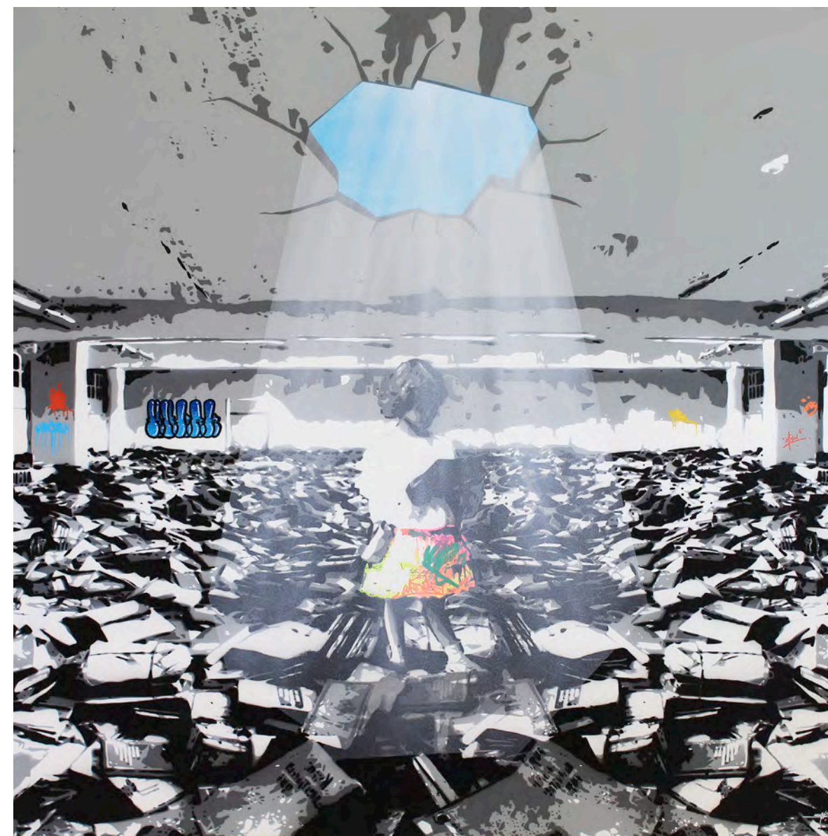
KURAR (né en 1983) Knowledge power, 2017 Pochoir de bombe aérosol sur toile signée, datée et titrée au dos 120 x 120 cm