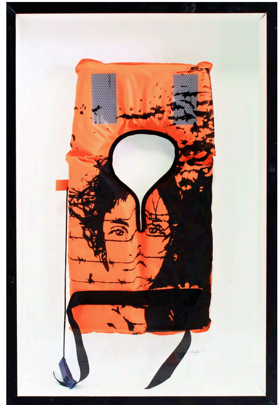
KURAR (né en 1983) Barbewire jacket, 2017 Acrylique sur gilet de sauvetage dans un emboîtement en bois et verre signé, daté et titré au dos du cadre 80 x 55 cm