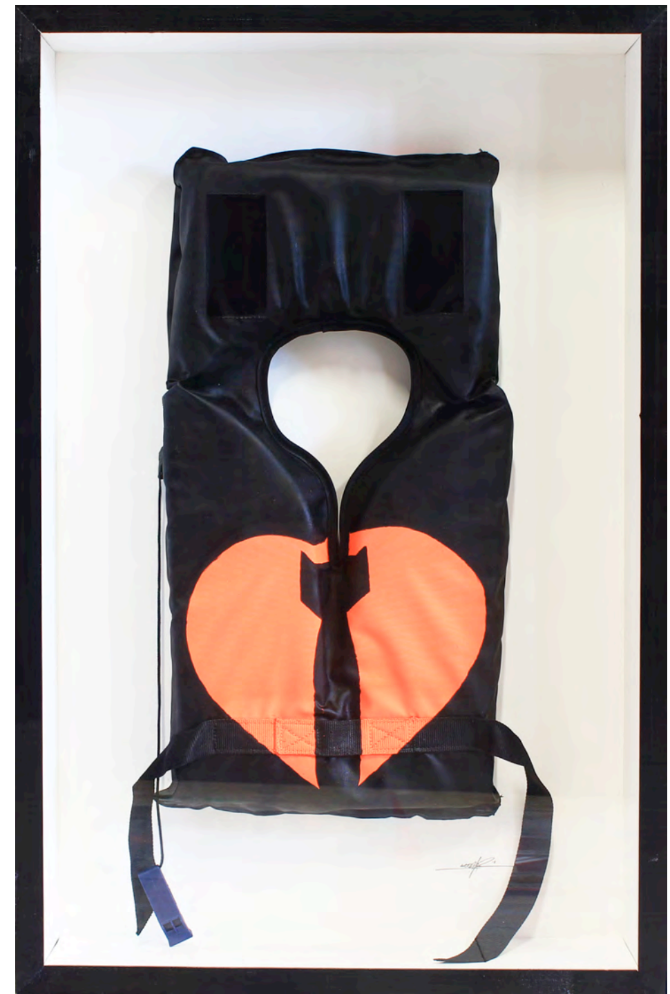
KURAR (né en 1983) Bomb jacket, 2017 Acrylique sur gilet de sauvetage dans un emboîtement en bois et verre signé, daté et titré au dos du cadre 80 x 55 cm