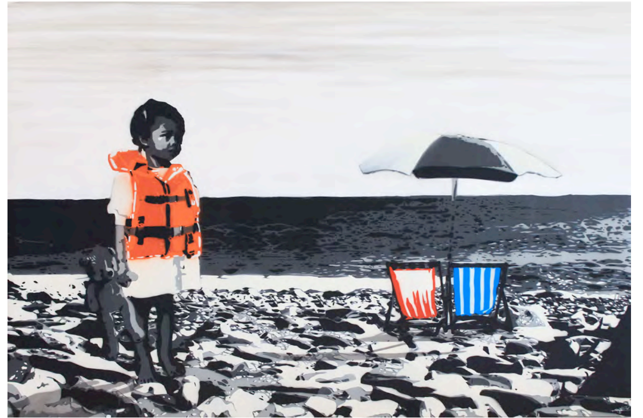
KURAR (né en 1983) Forced holidays, 2016 Pochoir de bombe aérosol sur toile signée, datée et titrée au dos 97 x 146 cm