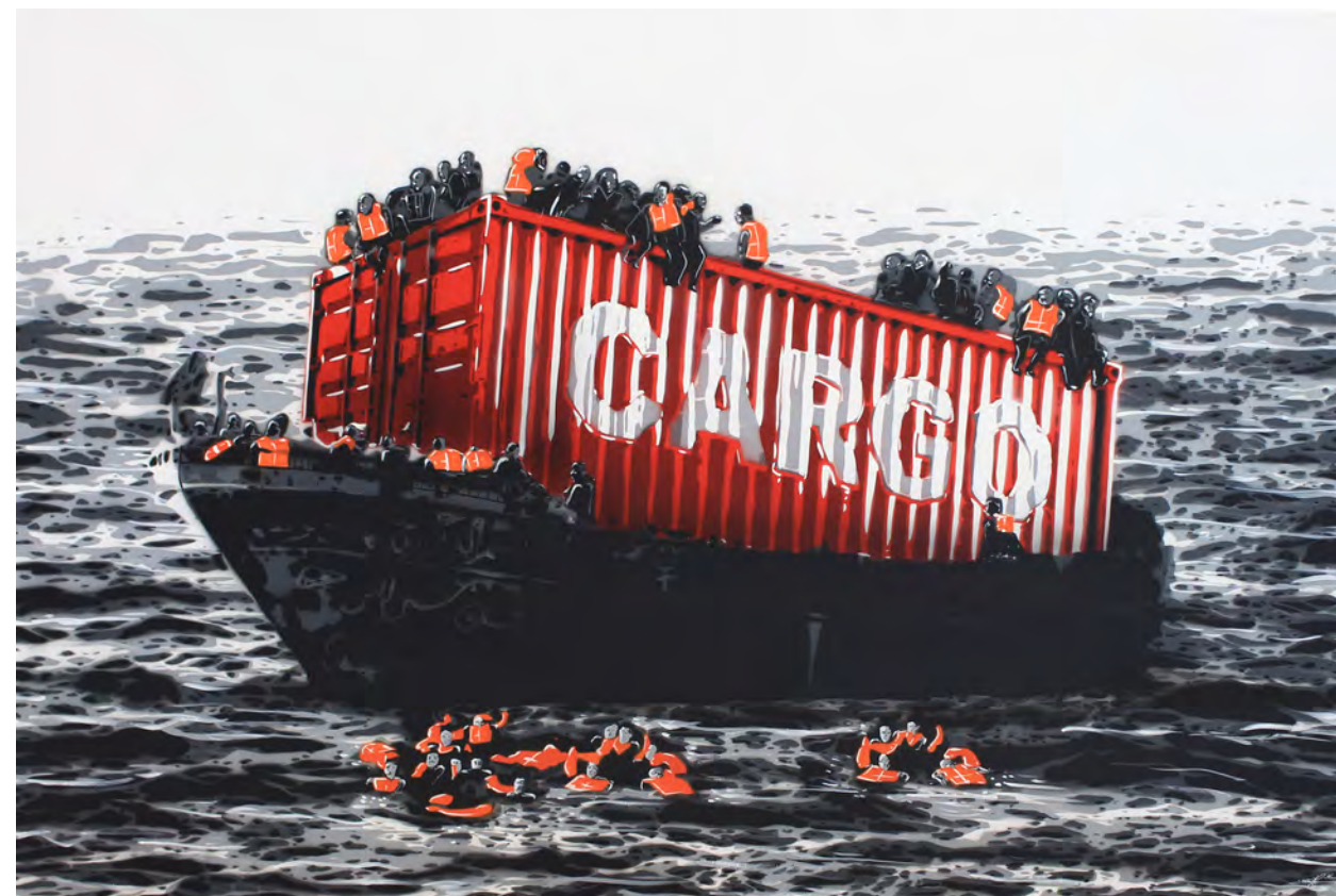
KURAR (né en 1983) Interesting migration, 2016 Pochoir de bombe aérosol sur toile signée, datée et titrée au dos 97 x 146 cm