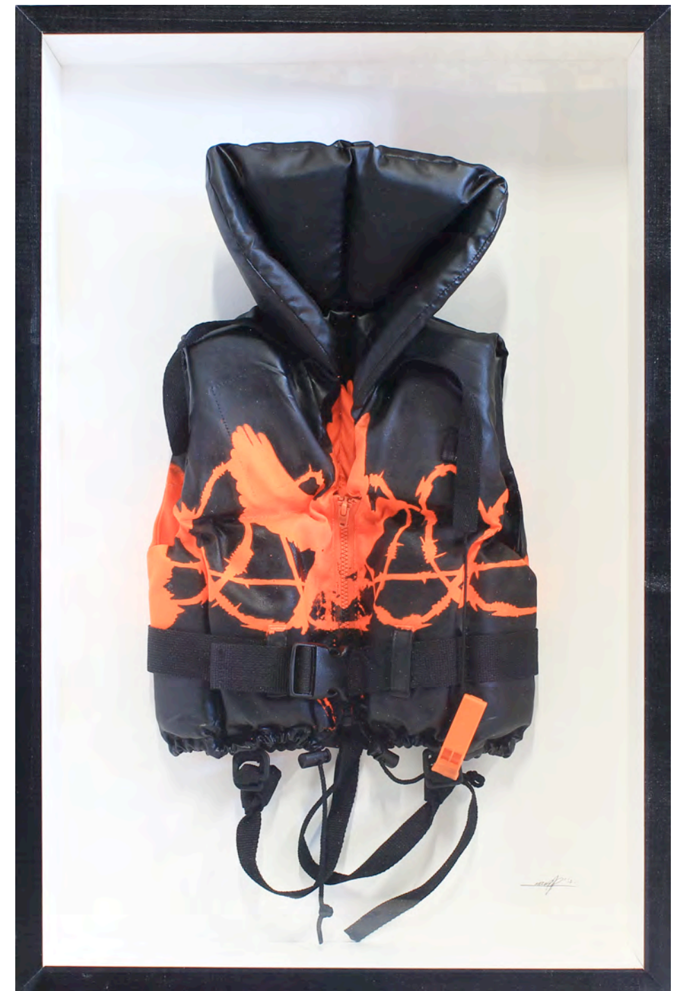
KURAR (né en 1983) Liberty jacket, 2017 Acrylique sur gilet de sauvetage dans un emboîtement en bois et verre signé, daté et titré au dos du cadre 80 x 55 cm