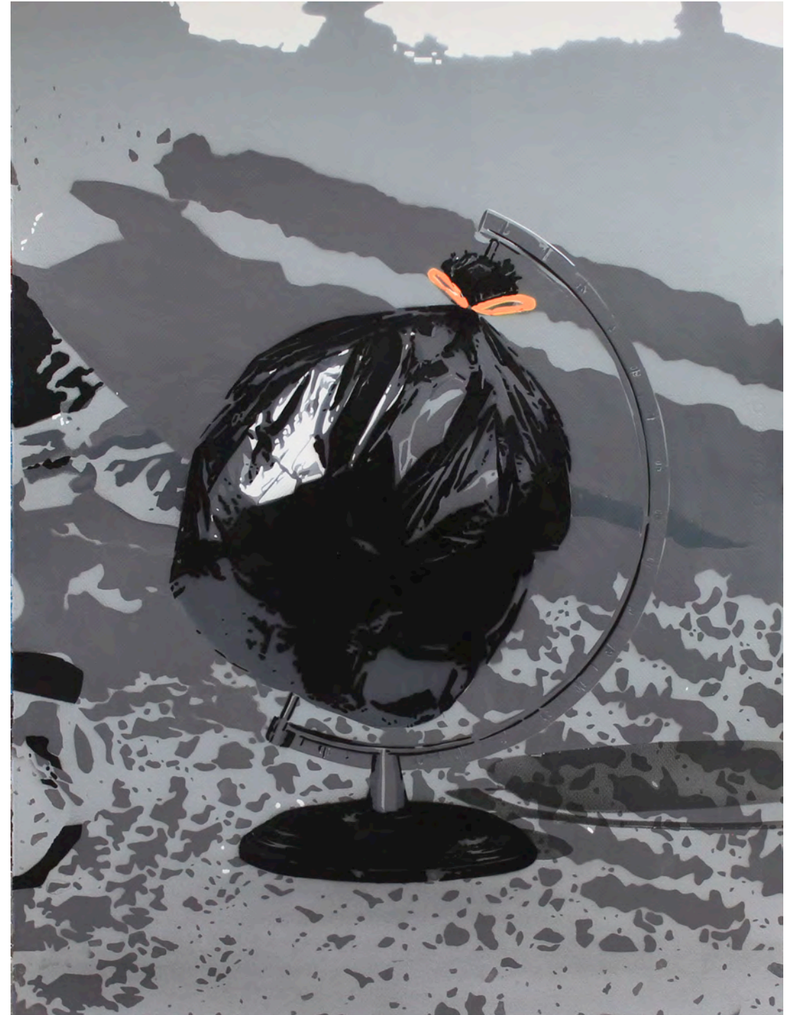
KURAR (né en 1983) World of waste, 2017 Pochoir de bombe aérosol sur papier signée, datée et titrée au dos 100 x 70 cm