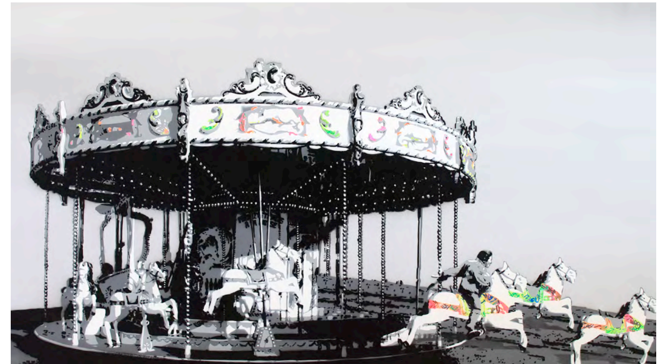
KURAR (né en 1983) Liberty, 2017 Pochoir de bombe aérosol sur toile signée, datée et titrée au dos 89 x 130 cm