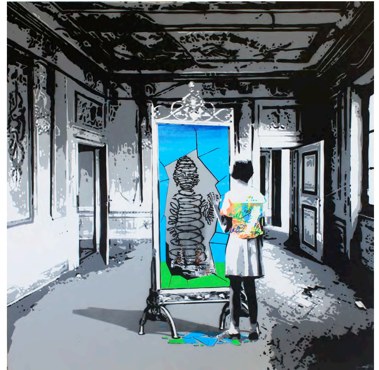
KURAR (né en 1983) 2 destiny, 2017 Pochoir de bombe aérosol sur toile signée, datée et titrée au dos 120 x 120 cm