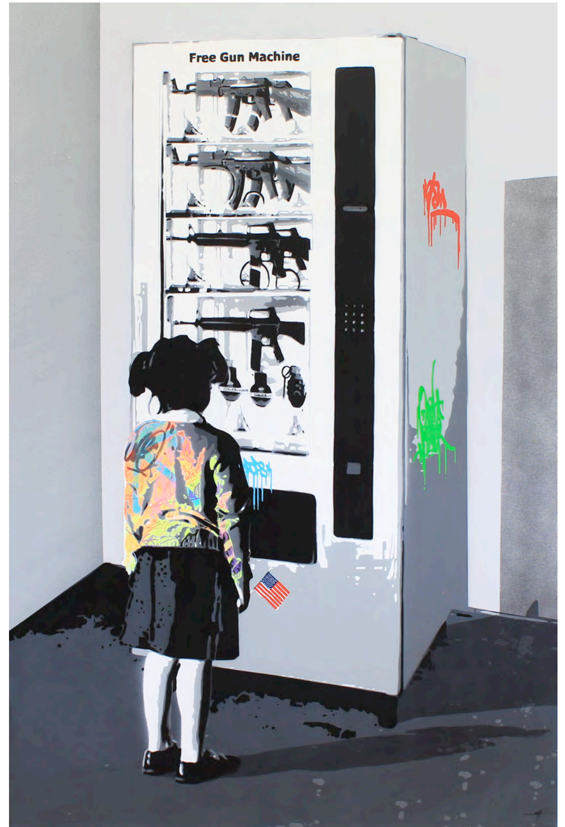
KURAR (né en 1983) Lifestyle, 2017 Pochoir de bombe aérosol sur toile signée, datée et titrée au dos 146 x 97 cm