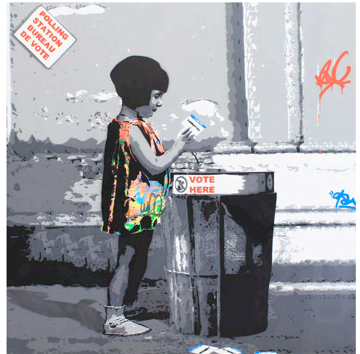
KURAR (né en 1983) Vote, 2017 Pochoir de bombe aérosol sur toile signée, datée et titrée au dos 120 x 120 cm